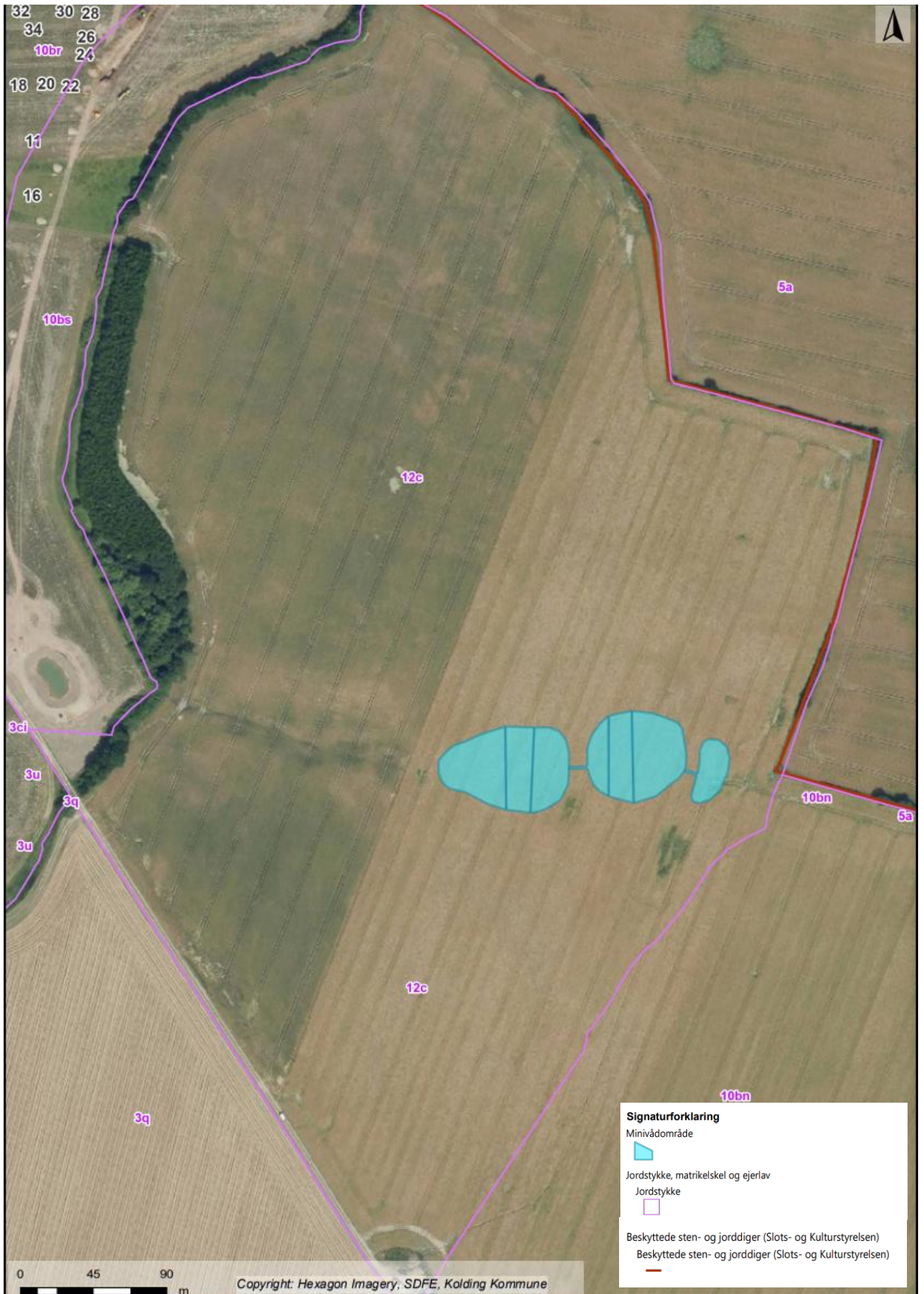
Kortbilag 2: Oversigtskort, der viser minivådområdets placering på matr.nr. 12c Vonsild By, Vonsild.