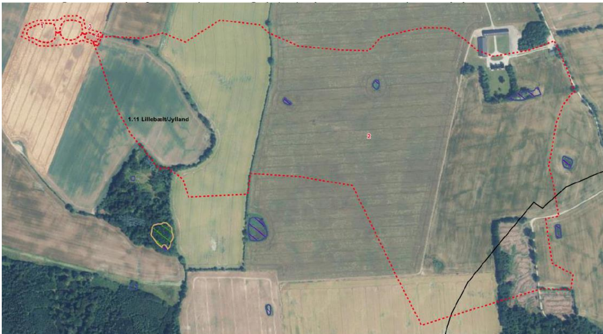
Kortbilag 5: Minivådområdets placering (1, 3, 4) samt drænoilandet (2)