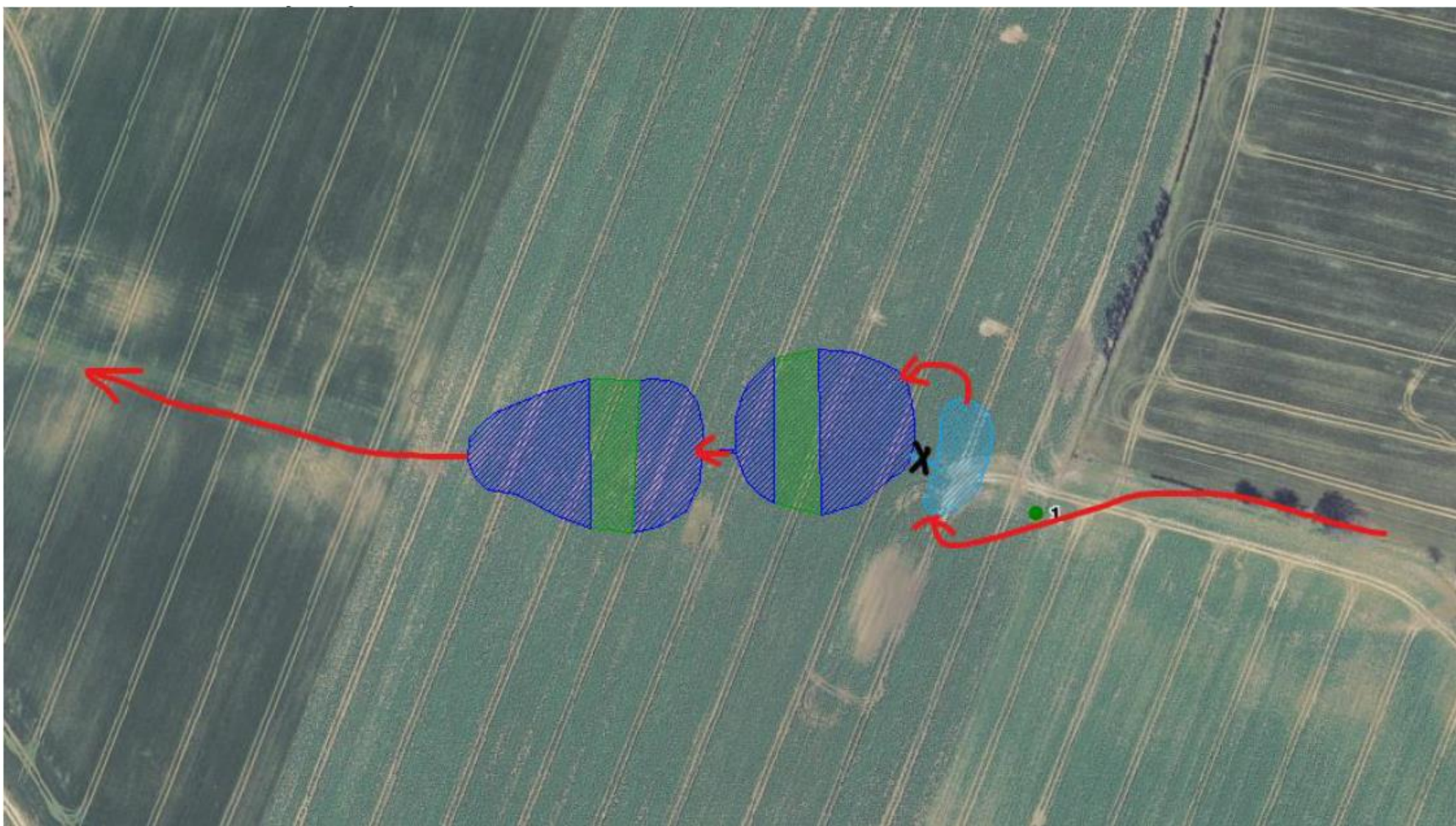
Kortbilag 3: Her fremgår minivådområdets forventede udformning og placering af ind- og udløb fra minivådområdet (rød).